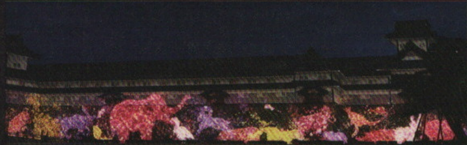
金沢城の石垣に住まう花と共に生きる動物たち Animals of Flowers, Symbiotic Lives in the Stone Wall - Kanazawa Castle

*meaning: Kanazawa Temple **meaning: Oyama Temple. Oyama was the former name of Kanazawa city