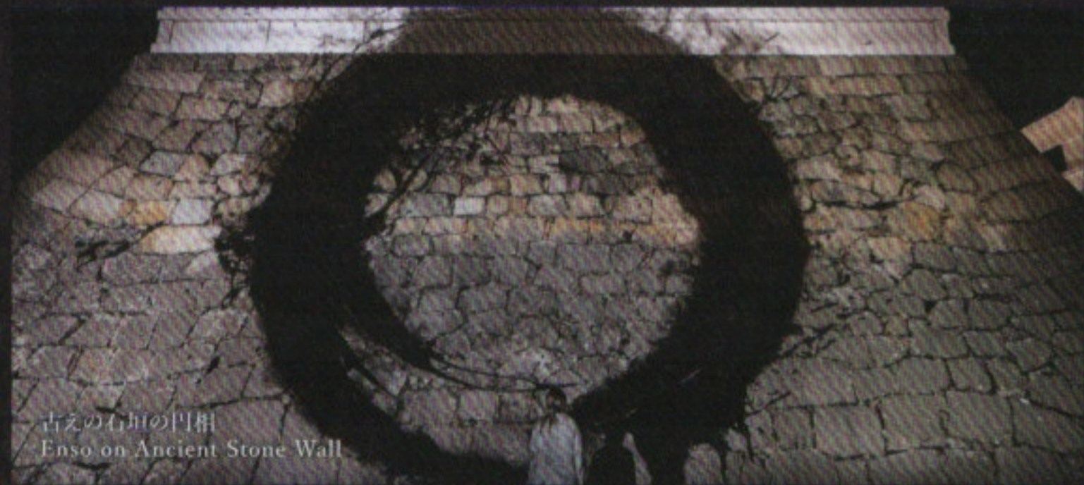
古来の石垣の門相 Enso on Ancient Stone Wall