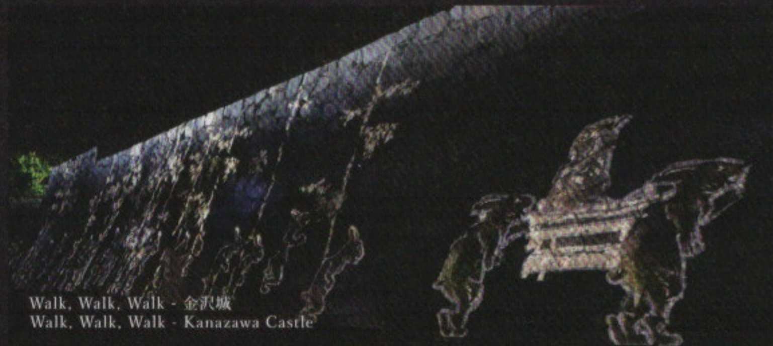
Walk, Walk, Walk - 金沢城 Walk, Walk, Walk - Kanazawa Castle