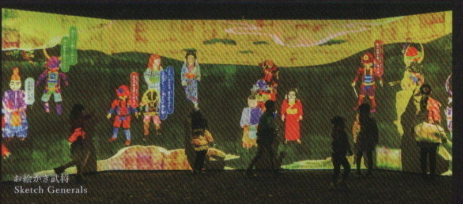
お絵かき武将 Sketch Generals