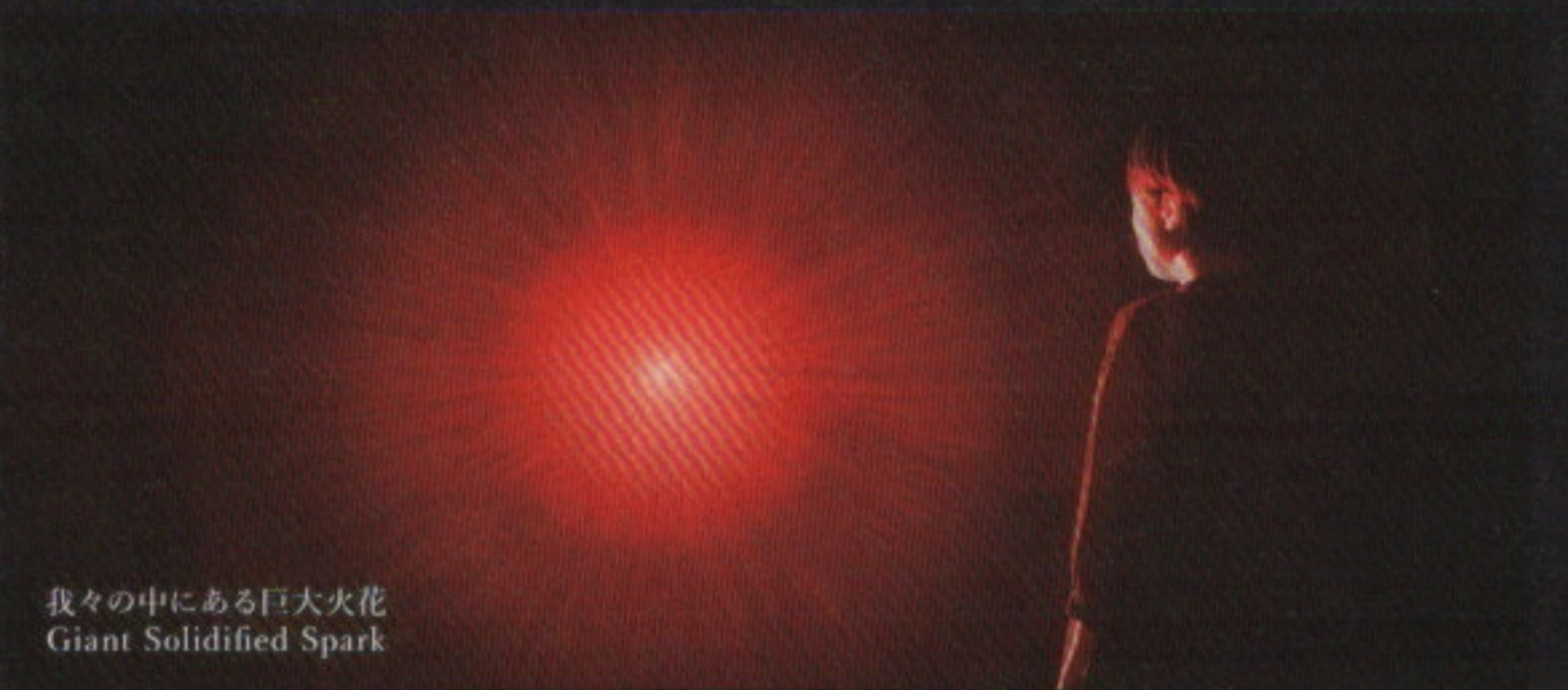
我々の中にある巨大火花 Giant Solidified Spark